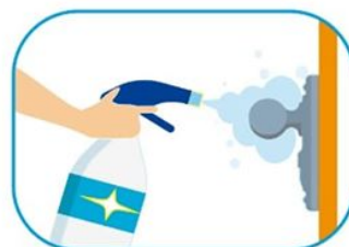
3 Limpiar las superficies de alto contacto