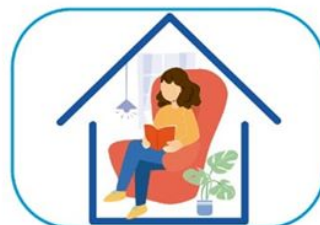
6 Quedate en casa