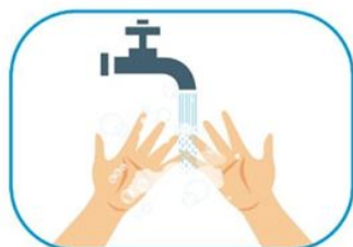
1 Lavado de manos