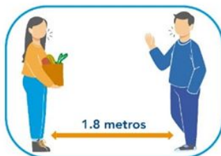
5 Distanciamiento social