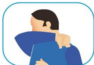
4 Protocolo de estornudo y tos