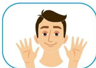
2 No se toque la cara si no se ha lavado las manos